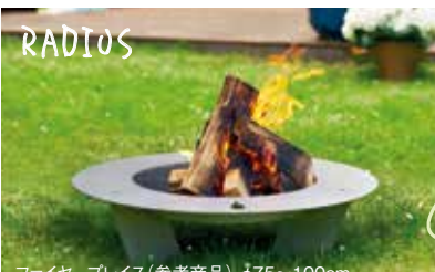
ファイヤープレイス(参考商品) φ75~100cm