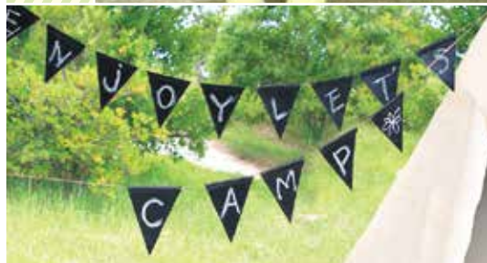
黒板フラッグガーランド 一連 1,290yen