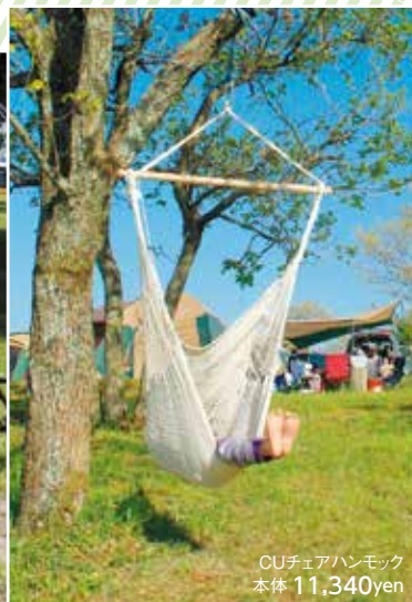
CUチェアハンモック 本体 11,340yen