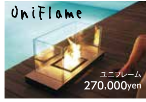
UniFlame ユニフレイム 270,000yen

オール電化の浸透によって火が無くても調理ができ、暖をとることができるようになりました。家の中から火が消えつつある昨今ですが、火の揺らぎには癒し効果があることは広く知られています。また、暖炉やキャンプファイヤーなどの大きな火には、その場にいる者同士の一体感を高めたり、会話が多くなるなどコミュニケーションが密になる効果があるそう。ウッドデッキやタイルテラスと合わせて火を囲む家族だらんの場をつくってみてはいかがでしょうか?