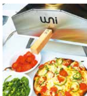
ユニ ユニ 42,984yen