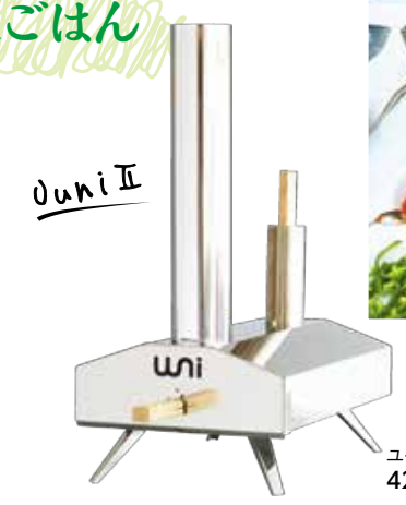
Uni II ユニ II 42,984yen