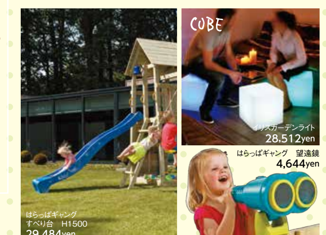
はらっぱキャンピング すべり台 H1500 29,484yen

屋下がりならフラッグガーランドでパーティー気分を盛り上げたり、夕暮れならキャンドルや持ち出せる灯りを取り入れた演出がおすすめです。