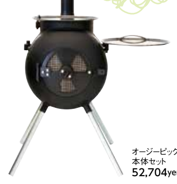
オージーピグ 本体セット 52,704yen